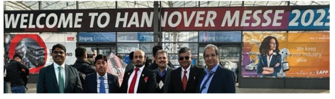
HANNOVER MESSE 2023