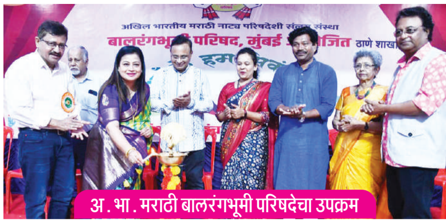
अ. भा. मराठी बालरंगभूमी परिषदेचा उपक्रम