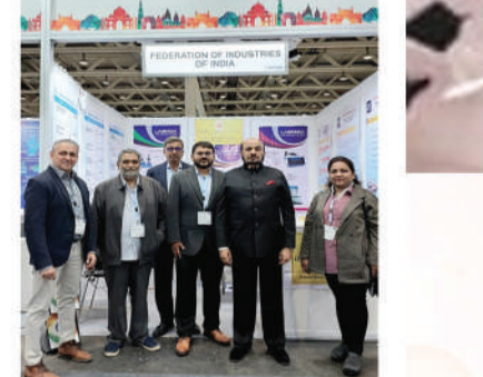
CHEMSPEC EUROPE-2023 BASEL, SWITZERLAND

STATE OF ART CORPORATE AUDITORIUMS fii@indofii.com | www.indofii.com