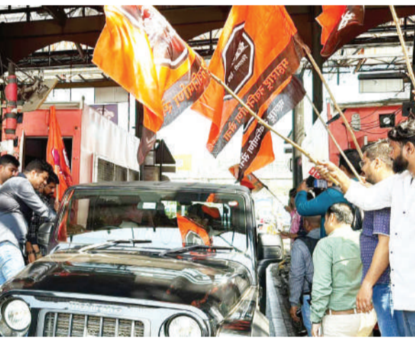
ठाण्यात भाजपा, शिवसेना आणि मनसेने जल्लोष करत पेढे वाटून आनंद व्यक्त केला.