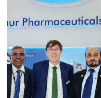
CPHI BARCELONA 2023